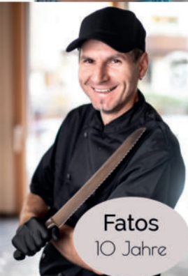
Fatos 10 Jahre