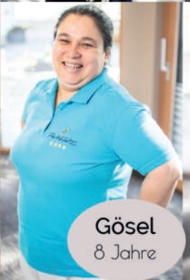
Gösel 8 Jahre