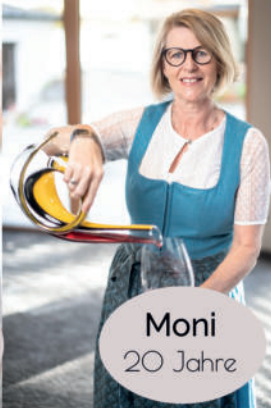
Moni 20 Jahre