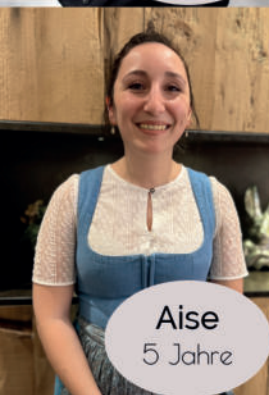
Aise 5 Jahre